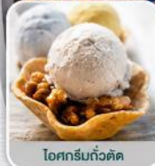
ไอศกรีมถั่วตัด