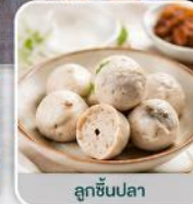
ลูกชิ้นปลา