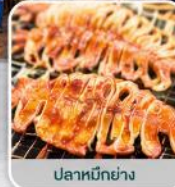
ปลาหมึกย่าง