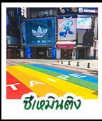
ซีเหมินตง