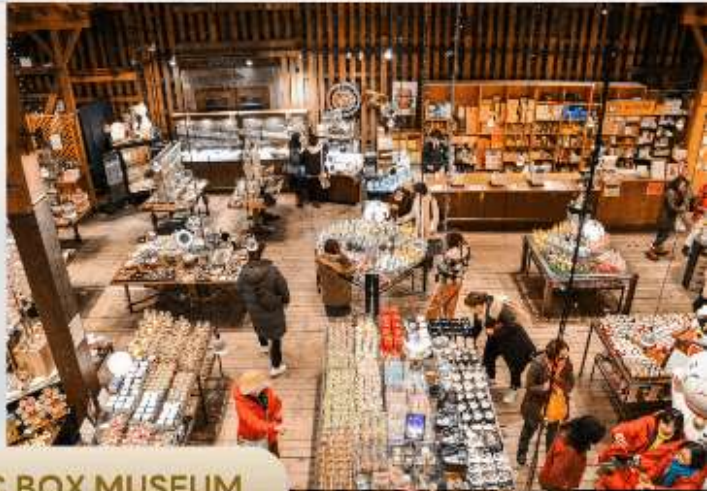
OTARU MUSIC BOX MUSEUM