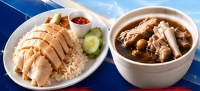
ข้าวมันไก่ปีนัง