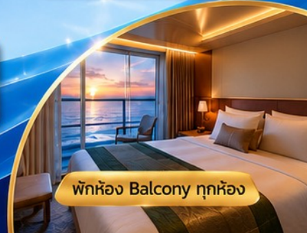
พักห้อง Balcony ทุกห้อง