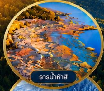
ธารน้ำห้ำสี่