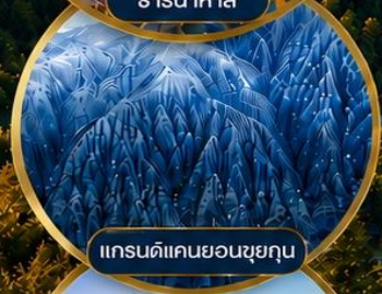
แกรนด์แคนยอนซุยกุ่ญ