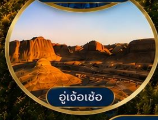
อู่เจ้อเซ่อ