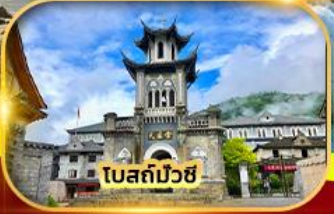
โบสถ์ปัวซี