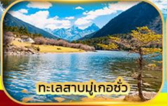
ทะเลสาบมู่เกอซิว