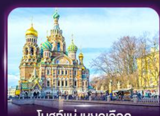
โบสถ์แห่งหอดูดาว