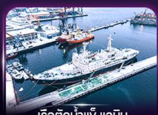
เรือตัดน้ำแข็งเลนิน