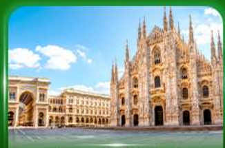
มหาวิหารดูโอโมแห่งมิลาน