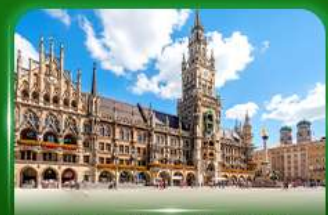
จัตุรัสมาเรียนพลัทซ์ มิวนิก