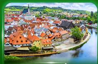
เมืองมรดกโลก เซสท์ครุมลอฟ