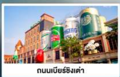
ถนนเบียร์ชิงเต่า