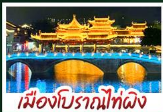
เมืองโบราณไท่ผิง