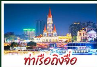
ท่าเรือกิ่งจื่อ

เขาชิงชิวสวนดอกไม้ตามฤดูกาล หมู่บ้านสไตล์ยุโรปเพียงยวี่ มิงซิง เสี่ยวเจี้ยน ถนนคนเดิน NANNING ZHIYE - เมืองโบราณไท่ผิง ท่าเรือกิ่งจื่อ - ถนนคนเดิน สามตรอกสองซอย