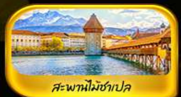
สะพานไมซ์าเปลา