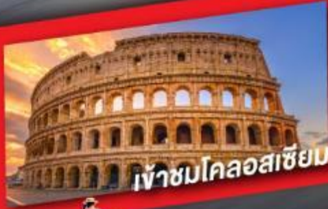
เข้าชมโคลอสเซียม