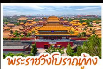
พระราชวังโบราณทุก