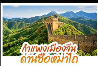
กำแพงเมืองจีน ด้านซือหม่าโต

มรดกโลกสุดยิ่งใหญ่ ใจกลางกรุงปักกิ่ง พระราชวังต้องห้าม (กู้กง) สัมผัสประสบการณ์ที่ขำขำแพงเมืองจีน ด้านซือหม่าโต (รวมกระเช้าขึ้น-ลง) • ซ้อปิงกบนบนหวงฝูจิง และซานหลี่กุน