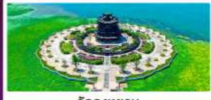
วิดงหววน