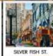
SILVER FISH ST.