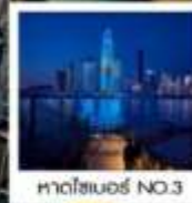
หาดโซเบอร์ NO.3

ขวดเบียร์สกรีนรูปของท่าน รัับฟรี!! ท่านละ 1 ขวด