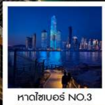
หาดไซเบอร์ NO.3