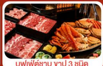
บุฟเฟ่ต์ซาบุมิ ซาปู 3 ชนิด