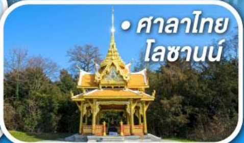
• ศาลาไทย โลซานน์

• สุดอากาศดีที่เซอร์แมท • ขึ้นกระเช้าสู่ยอดจากลาเซียร์ 3000 • ชมเมืองคลาสสิกเบิร์น ลูเซิร์น ซูริก