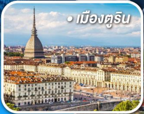
• เมืองตูริน