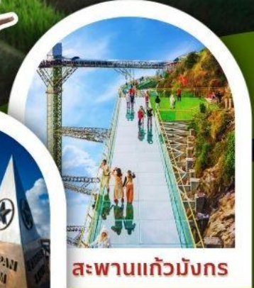
สะพานแก้วมิงก