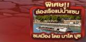
พิเศษ!! ล่องเรือแม่น้ำเซน ชมเมือง โดย บาโต บูช