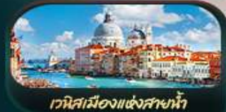
เวนิสเมืองแห่งสายน้ำ