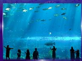
อควาเรียมยักษ์รูปเต่า