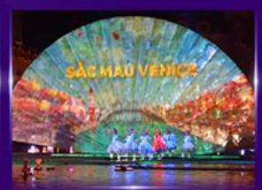
Sac Mau Venice Show