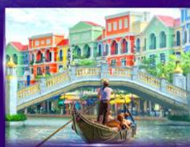
เวนิสจำลอง แกรนด์ เวิลด์