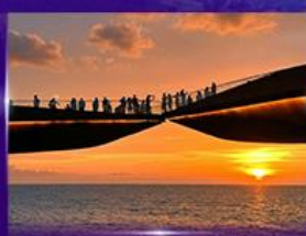
สะพานจูบ Sunset Town