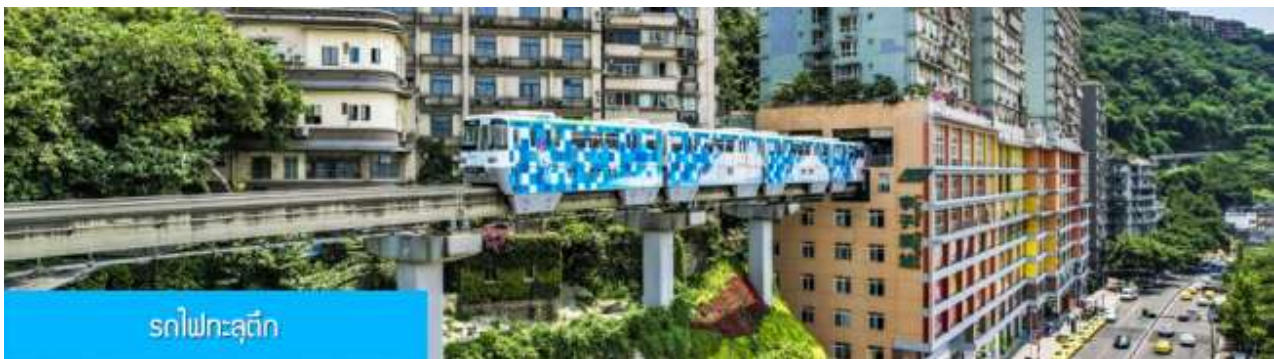
รถไฟทะเลตุ๊ก