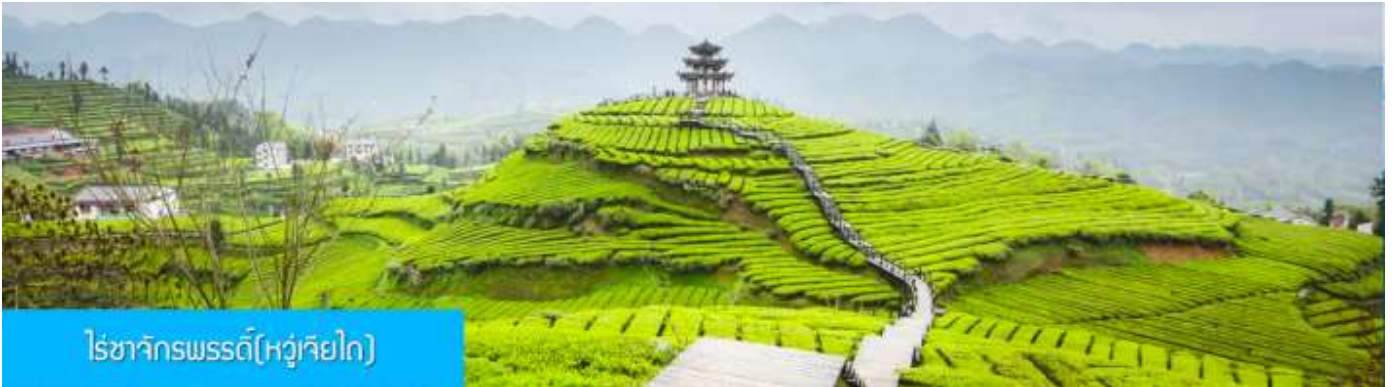
ไรชาจักรพรรดิ(หวู่เกียโก)