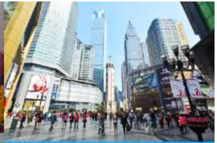
ย่านเจียงฝางเป่ย์