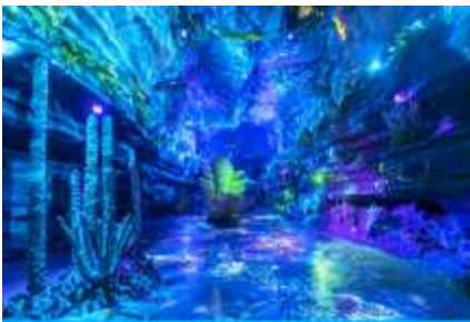
ป่าหิน สั่วปู้ย่า