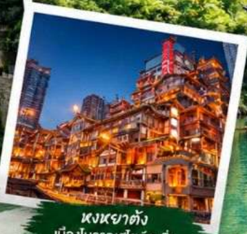
หงหยาดัง เมืองโบราณสไตล์ฉงชิ่ง