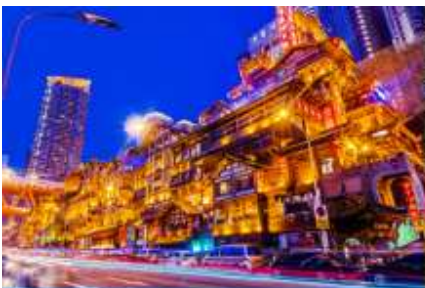
ย่านหงหยาดัง