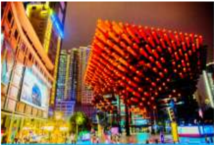
หอศิลป์กั๋วไท่