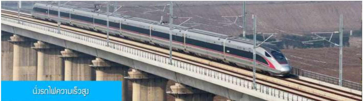
เบอร์ดรถไฟความเร็วสูง

รับประทานอาหารเช้า ณ ห้องอาหารของโรงแรม (10)