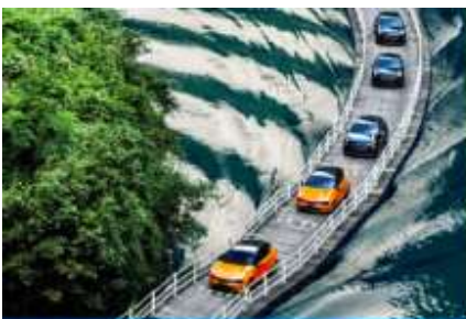
ถนนลอยน้ำด่านสิงโต