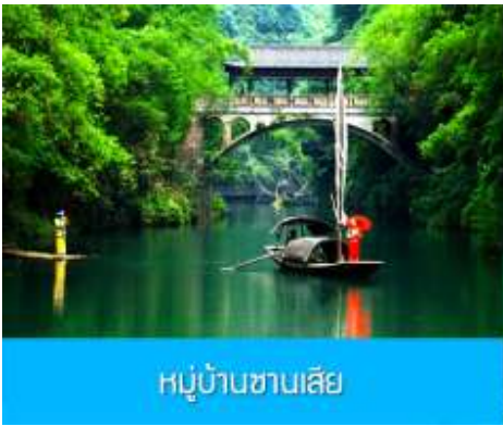
หมู่บ้านซานเสี