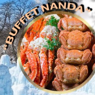
LAKE SHIKOTSU ICE FESTIVAL 2027