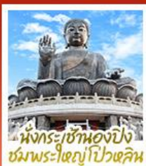
นั่งกระเช้ามองปิง ชมพระใหญ่โป้วหลิม

นั่งกระเช้ามองปิงสักการะพระใหญ่โป้วหลิม • วัดหวังต้าเซียน ขอพรสุขภาพ ความรัก วิชาแขนงหิว ขอพรองค์เซกุก โขคลาก การเงินและธุรกิจ • เจ้าแม่กวนอิมรพีลาลัย ธิพพลังงานดี เสริมพลังฮวงจุ้ย • วัดมื่นไทมว ขอพรเรื่องการศึกษ การงาน สติปัญญาและความกล้าหาญ