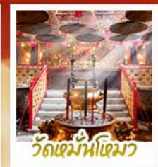
วัดเม้าหน้ไทมว