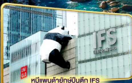
หมีแพนด้ายักษ์ปีนตึก IFS