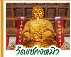
วัดเซ่งกั๋วฮิว