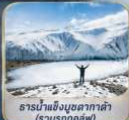
ธารน้ำแข็งมูซตาคาต้า (รวมรถกอล์ฟ)