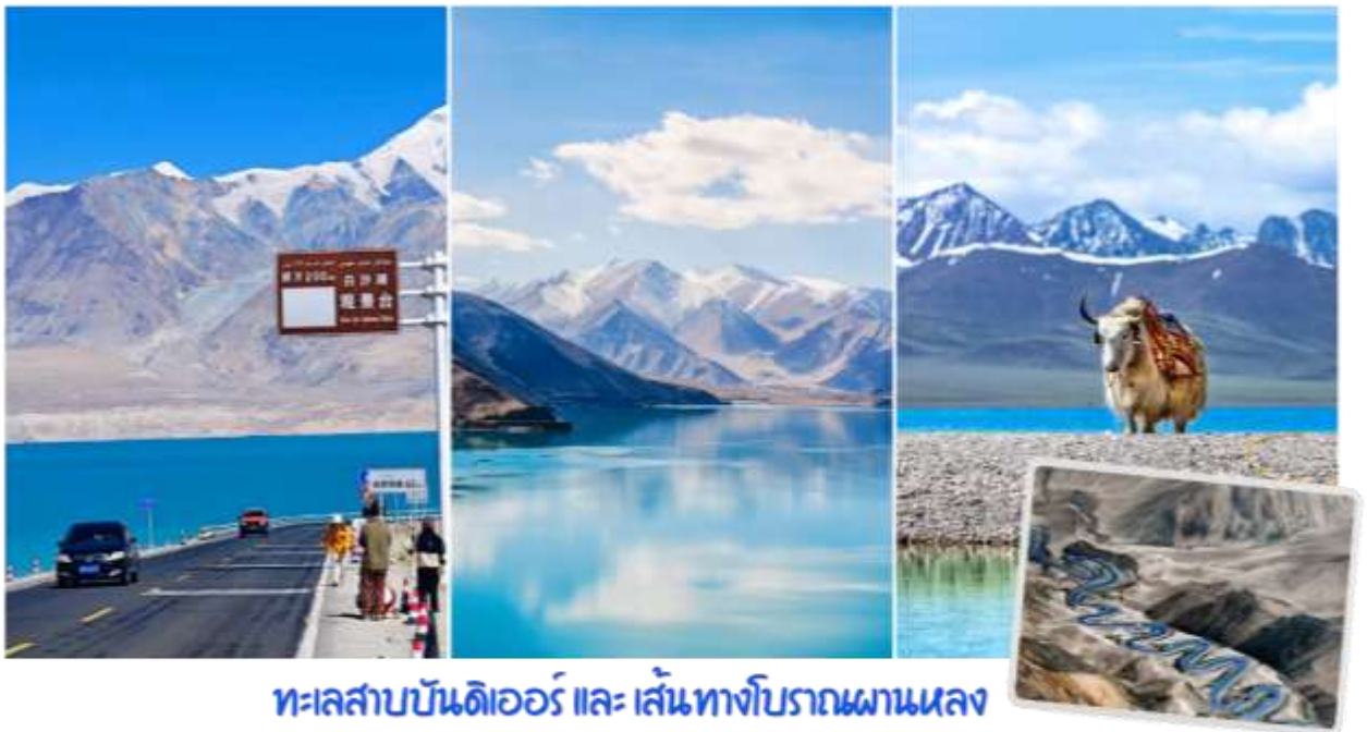
ทะเลสาบบันดิเออร์ และ เส้นทางโบราณผานหลง

นำท่านสู่ ถนนเส้นทางโบราณผานหลง (Panlong Ancient Road) ตั้งอยู่บนที่ราบสูงพามีร์ (Pamir Plateau) เขตเมืองทาชกูร์กัน (Taxkorgan) ทางตอนใต้ของเขตปกครองตนเองซินเจียงอุยกูร์ ประเทศจีน ถนนบนภูเขาที่คดเคี้ยวเลี้ยวลดอันตระการตาในเขตปกครองตนเองทาชกูร์กัน (Taxkorgan) ทางตอนใต้ของซินเจียง ประเทศจีน มีฉายาว่า "ถนนมังกรขด" ขึ้นชื่อเรื่องโค้งหักศอกกว่า 600 โค้ง บนภูเขาสูงชัน เป็นแลนด์มาร์กสำคัญสำหรับสายถ่ายภาพและคนรักการเดินทางที่ต้องการท้าทายฝีมือการขับขี่ ให้ทัศนียภาพที่สวยงามและแปลกตาของแนวภูเขาสูงชันและทะเลทรายในเขตซินเจียง จากนั้นนำท่านเปลี่ยนรถเป็นรถ 7 ที่นั่ง เพื่อเดินทางสู่ทะเลสาบบันดิเออร์ ทะเลสาบบันดิเอร์ (Bandir Blue Lake) หรือ อ่างเก็บน้ำเซียบันดี (Xiabandi Reservoir) เป็นทะเลสาบสีฟ้าครามใสบริสุทธิ์ที่ตั้งอยู่ท่ามกลางเทือกเขาพามีร์ ในเขตปกครองตนเองซินเจียงอุยกูร์ ประเทศจีน ขึ้นชื่อเรื่องวิวธรรมชาติที่สวยงามราวกับภาพวาดและน้ำสีฟ้าเข้มอันเป็นเอกลักษณ์จากการละลายของน้ำแข็ง น้ำสีฟ้าเทอร์ควอยซ์ตัดกับเทือกเขาสีน้ำตาลและท้องฟ้าสีคราม เป็นจุดถ่ายภาพที่ยอดนิยมในเส้นทางชมธรรมชาติบนที่ราบสูงพามีร์