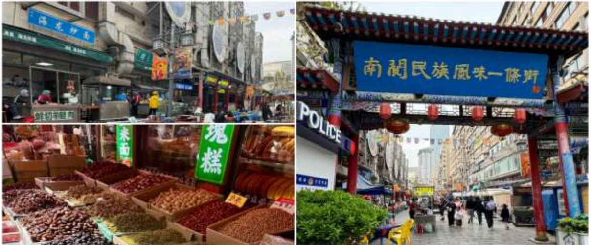
ถนนคนเดินเซี่ยหนานกวน

สมควรแก่เวลานำทุกท่านเดินทางสู่สนามบิน เพื่อทำการเช็คอินกับสายการบิน