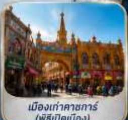
เมืองเก่าคาซการ์ (พิธีเปิดเมือง)