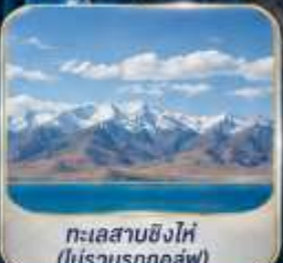
ทะเลสาบซิงไห่ (ไม่รวมรถกอล์ฟ)