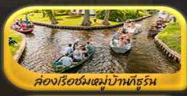
ล่องเรือชมหมู่บ้านกังหัน