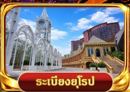
ระเบียงยุโรป