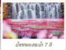
น้ำตกทะเลสาบน้ำ 7 สี

โหลด 23 KG. x1 ทั้งไป - กลับ ฟรีมัคนิยบัตร ไม่เข้าร้านรัฐบาล ทัวร์กรุ๊ปเล็ก รวมค่าเข้าชมสถานที่ตามโปรแกรม