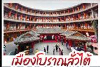
เมืองโบราณลั่วไค