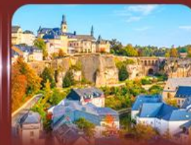
ย่านเมืองเก่า ลักเซมเบิร์ก