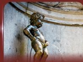
manneken pis บรัสเซลส์