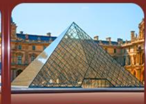
เข็ควินพิพิธภัณฑสถานลูฟวร์ ปารีส