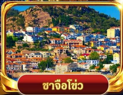
ซาจิวโซ่ว