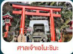
ศาลเจ้าอินะชิมะ

เดินทาง 01-05 ก.ค.69 15-19, 18-22 ก.ค.69