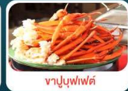
ชาบูบุฟเฟ่ต์