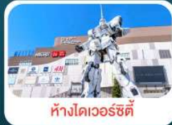
ห้างไดเวอร์ซิตี