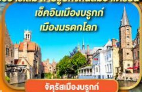
จัตุรัสเมืองบรูจก์