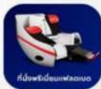
ที่นั่งพริ้นแบบฟลัดดิง