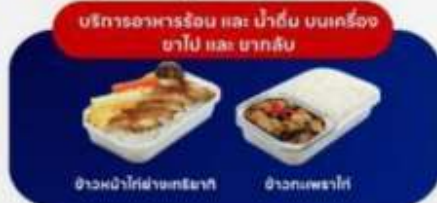
บริการอาหารร้อน และ น้ำดื่ม บนเครื่อง ขาไป และ ขากลับ