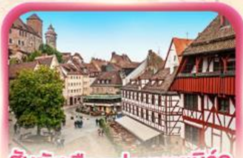
สัมผัสเมืองเก่าบูเรมเบิร์ก