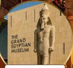
พีพีรภัณฑ์แกรนด์อียิปต์