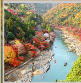
“ARASHIYAMA MT. KAMEYAMA”