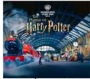
แฮร์รี่ พอตเตอร์ สตูดิโอโตเกียว