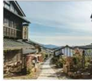
มาโกะเมะจุกุ