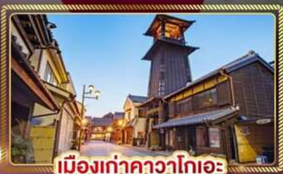
เมืองเก่าคาวาโกเอะ