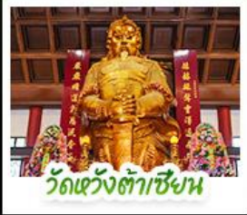
วัดหวังต้าเซียงน

พัก 4 ดาว ย่านช้อปปิ้งจิมซาจ่ยหรือย่านมงก๊ก สนุกสนานไปกับสวนสนุกดิสนีย์แลนด์แบบเต็มวัน (รวมรถรับ-ส่ง) วิวหวังต้าเซียน หอพระด้านสุขภาพ • วิวเขangkหมิว หอพระโชคลาภ การเงินและธุรกิจ • เจ้าแม่กวนอิมฮ่องกง นมัสการองค์เจ้าแม่กวนอิม ที่มีอายุกว่า 600 ปี • เน็กระเซ้าเองปิงสิ่งการะพระใหญ่เทียนถาน