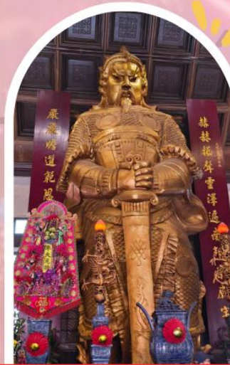
วัดเซกวง ขอพรโชคลาภ การเงิน และธุรกิจ