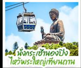
เน็กระเซ้าเองปิง ไขว้พระใหญ่เทียนถาน