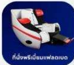
ที่นั่งพรีเมียมแพลตฟอร์ม

บริการอาหารร้อน และ น้ำดื่ม บนเครื่องบินขาไป และ ขากลับ