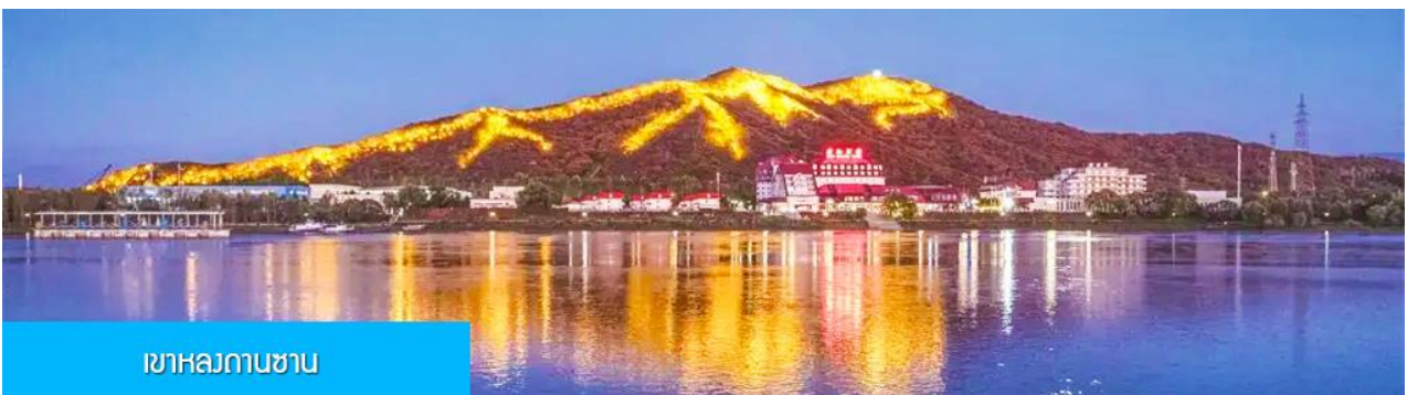
เขาหลงกานซาน

หลังอาหารนำท่านผ่านชม วิวยามค่ำของเขา หลงกานซาน 龙潭山夜景 (ผ่านชมระยะไกล) ภูเขารูปทรงคล้าย มังกรในช่วงกลางคืนภูเขาถูกประดับด้วยแสงไฟที่สามารถมองเห็นแต่ไกล คล้ายรูปมังกร (บางคนมองว่าคล้ายรูปไดโนเสาร์) จากนั้นนำท่านเดินทางเข้าที่พัก