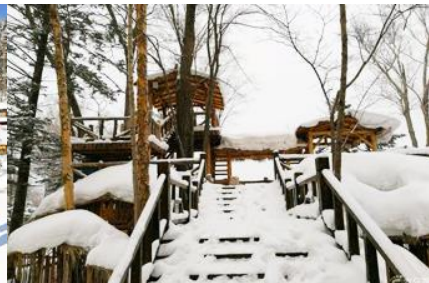
ระเบียงชมวิวยิ่งจฺยชาน

วันที่สาม เมืองฮาร์บิน-สถานีรถไฟยาบูลี-รวมนั่งม้าลากเลื่อน- หมู่บ้านหิมะ Xue xiang China Snow Town - ระเบียงชมวิวยิ่งจฺยชาน- ชมแสงสียามราตรีหมู่บ้านหิมะ-ชมพลุไฟและขบวนพาเหรดระบำพื้นเมือง-นอนในหมู่บ้านหิมะ Xue xiang