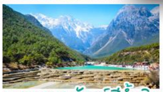
เขุบเขาพระจันทร์สีน้ำเงิน