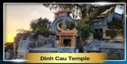
Dinh Cau Temple