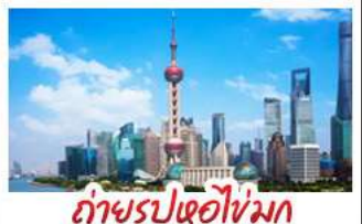
ถ่ายรูปหอไข่มุก