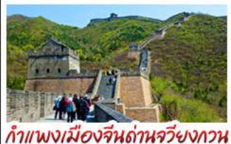
กำแพงเมืองจีนด้านจวิ้นกวน

UNIVERSAL STUDIO BEIJING DISNEYLAND SHANGHAI รถไฟความเร็วสูง - ถ่ายรูปหอไข่มุก กำแพงเมืองจีนด้านจวิ้นกวน มื้อพิเศษ เปิดปักกิ่ง, สุกี่หม้อไฟ BUFFET