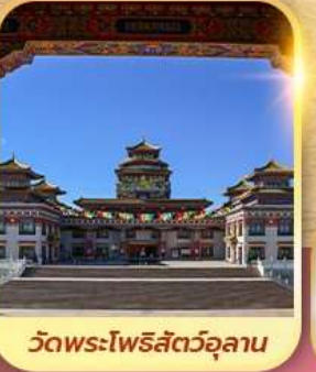
วัดพระโพธิสัตว์อูลาน