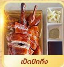
เปิดปอกถึง