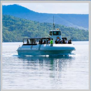
“LAKE SHIKOTSU GLASS BOAT”