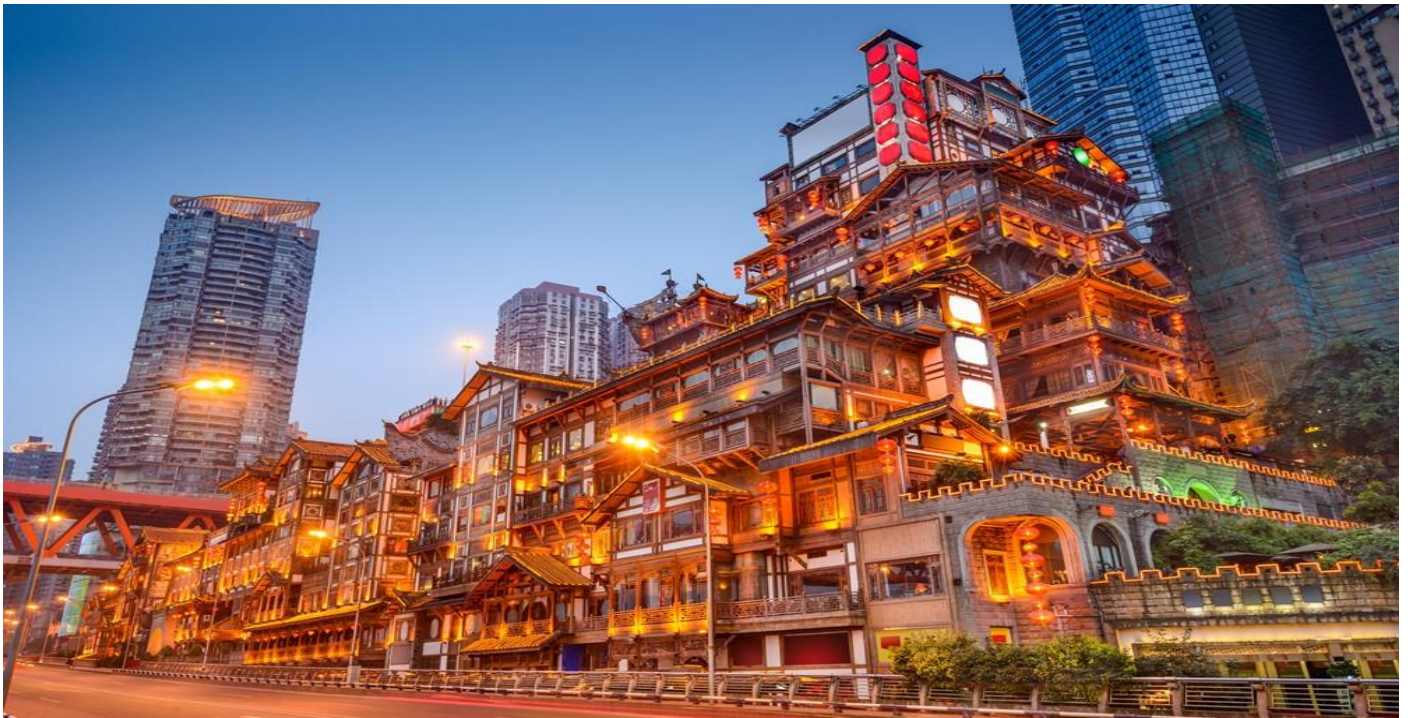
ที่พัก HOLIDAY INN EXPRESS หรือเทียบเท่าระดับ 4 ดาว

จุดชมวิวที่สามารถมองเห็นทิวทัศน์ของแม่น้ำเจียงหลิงและเมืองฉงชิ่งได้อย่างสวยงาม ยามค่ำคืนจะเต็มไปด้วยแสงไฟสีทองนวลที่ส่องสว่าง ทำให้ที่นี่มีบรรยากาศที่งดงามและโรแมนติกจนหลายคนเปรียบเทียบกับฉากในภาพยนตร์แอนิเมชัน Spirited Away อีกทั้งยังเป็นจุดถ่ายรูปที่สำคัญของนักท่องเที่ยวอีกด้วย