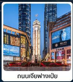
ถนนเจียฟางเป่ย